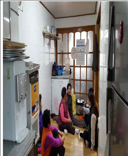
<환경이 개선된 경로당과 주민들>