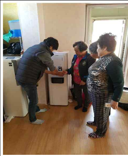
<정수기 전달 및 시연>