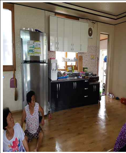
<환경이 개선된 경로당과 주민들>