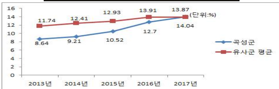
유사 지방자치단체와 재정자립도(당초예산) 비교