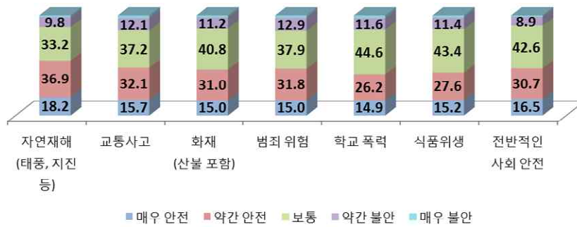
사회 안전에 대한 인식